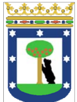
Ecu de Madrid